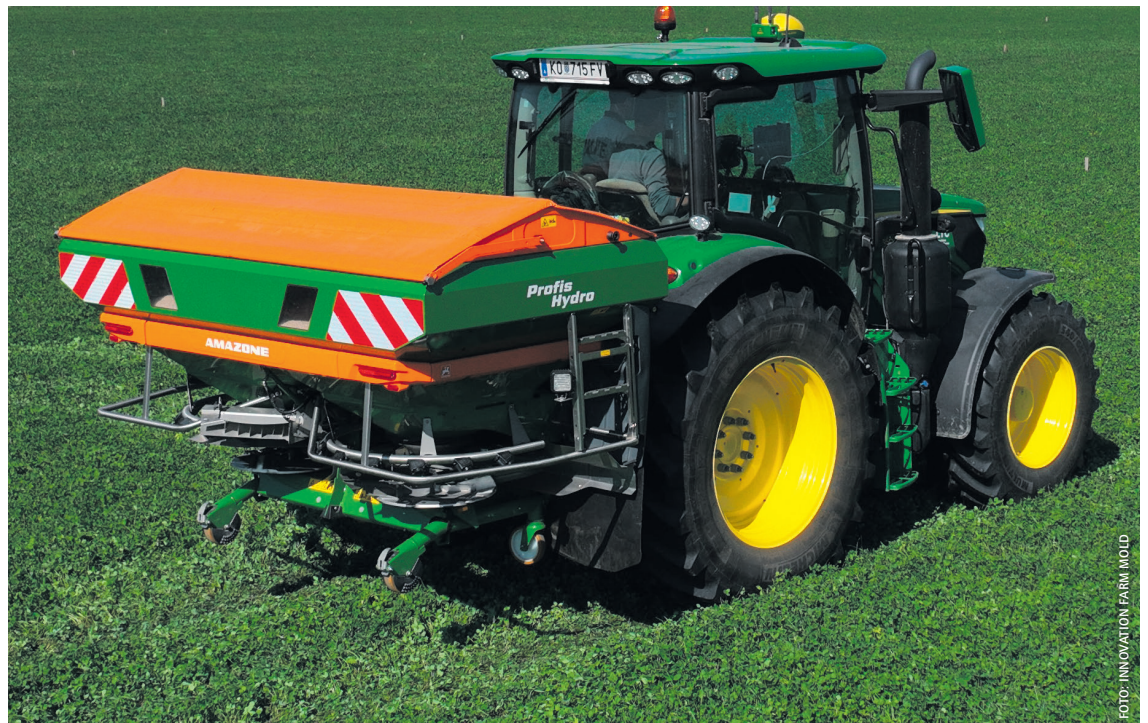
Der auf den Versuchsflächen eingesetzte Anbaustreuer ZA-TS brachte den NPK-Dünger aus.

19 Landwirte, die ohne diese moderne Technik den Dünger (NPK 15/15/15) ausbringen mussten. Mit ihnen wurden die in der Praxis üblichen Schalt-