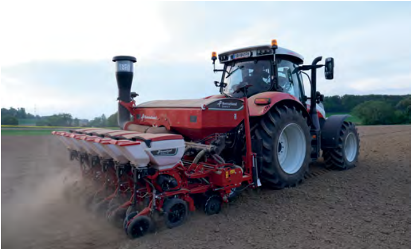
Aussaat von Körnermais mit der Einzelkornsämaschine «Optima V» in sechsreihiger Ausführung und Anlage der Parzellen.