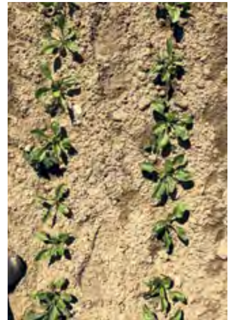
Jugendentwicklung im Dreiecksverband bei Rübe mit 45 cm Reihenabstand und einem Abstand von 20,2 cm zwischen den Pflanzen.

Auch bei der Zuckerrübe ist das Ergebnis aufgrund hoher Kompensationsleistungen der Kultur ähnlich. Durch die durchgehend gute Wasserversorgung über die gesamte Vegetationsperiode konnten kei-