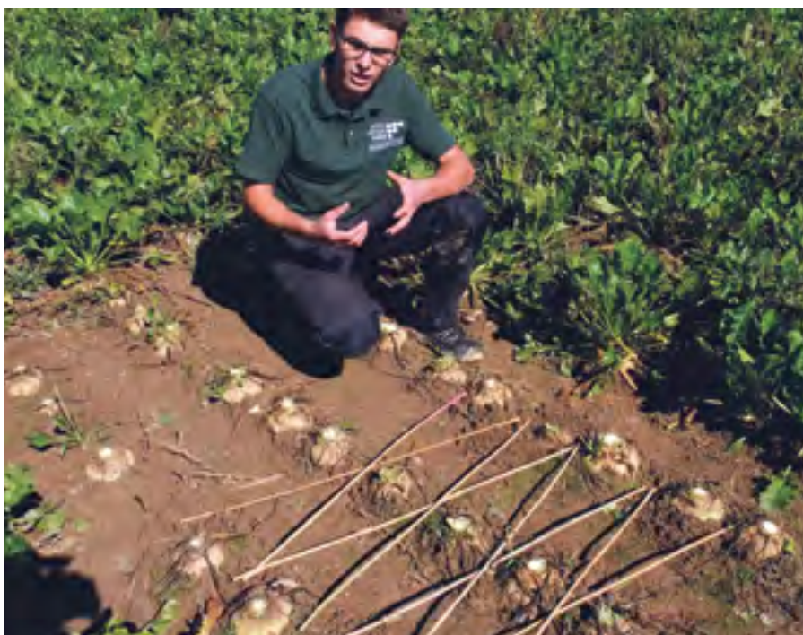
Veranschaulichung des Dreiecksverbands in Zuckerrüben.

Mit Unterstützung von Bund, Ländern und Europäischer Union.