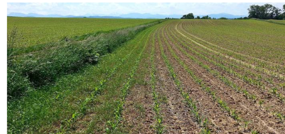
Der Feldrand braucht besondere Aufmerksamkeit um die Ausbreitung der Quecke einzudämmen.

Viele Unkräuter und Ungräser wandern vom Feldrand in die Ackerflächen ein, breiten sich anschließend weiter im Be-