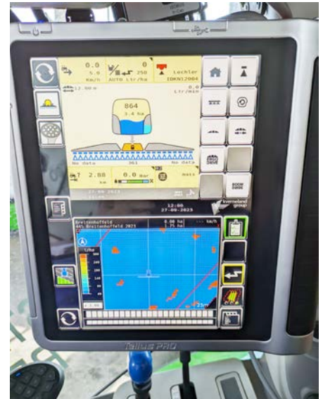
Geteiltes Terminal mit Applikationskarte sowie Tankdarstellung.

stand aus und dringen im Laufe der Zeit bei fehlender Bekämpfung in das Feldinnere vor.