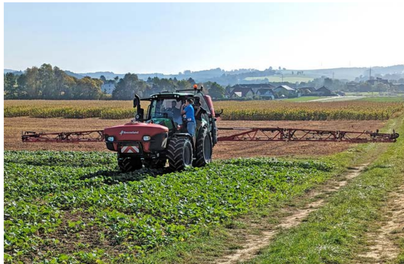
Die Kombination aus Fronttank und Anbaufeldspritze hatte im Praxiseinsatz im Winterraps viele Vorteile.