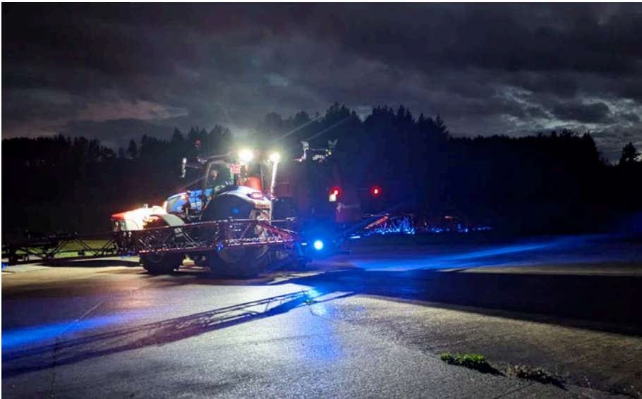
Drei Hybrid-Ultraschall-Sensoren messen beim Boom Guide Pro den Abstand zwischen Boden und Kultur.