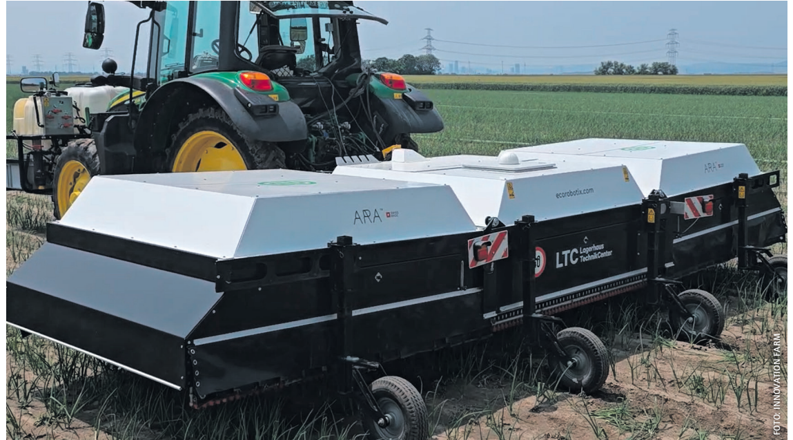
Die ARA-Spritze mit drei Modulen mit je zwei Metern Breite und zwei Fronttanks im Feldeinsatz.

Im Heck befand sich der eigentliche Spotsprayer (Gewicht 1.200 kg). Es bestand aus drei Arbeitsmodulen mit einer Breite von jeweils etwa